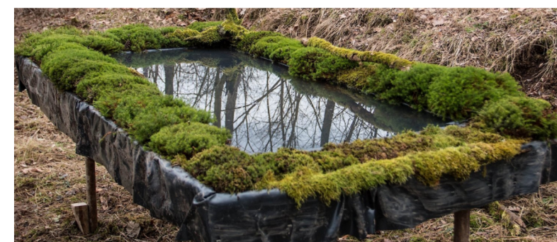
příklad mechového ptačího koupadla - realizovaný prvek bude mít nepravidelný tvar