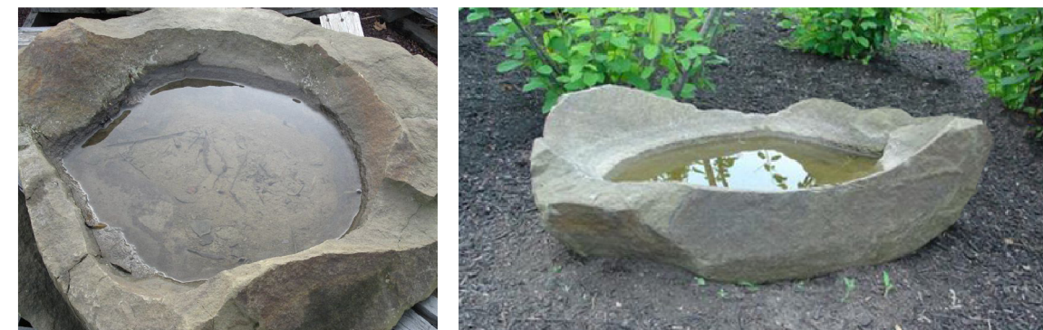
příklad kamenného ptačího koupadla - kamenicky upravená mísa